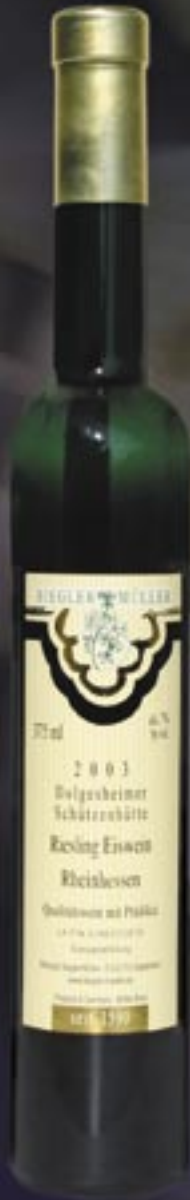
Wein - Nr. 524

2003 Schützenhütte Riesling EISWEIN: Feine Frucht, feiner Säurespiegel, ein Gaumenerlebnis, exotischer Duft von Zitrus, unschlagbar in Kombination mit einem Blau- schimmelkäse. Ein großer Wein!