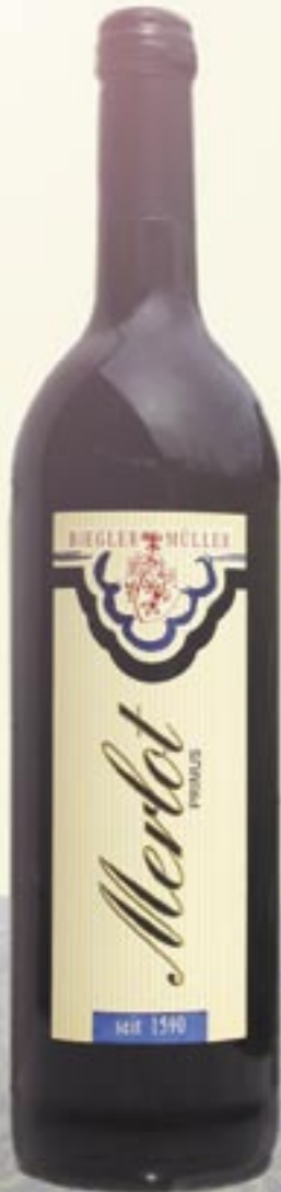
Wein - Nr.: 120